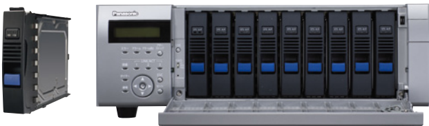
別売ハードディスクユニット

また、増設ユニット(WJ-HDE400)を最大5台接続可能。 この組み合わせにより、最大216 TBのシステム構築が可能です。